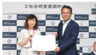
▲株式会社日本トリム 福岡支店