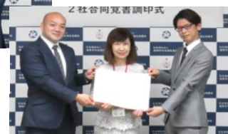
▲株式会社アスパートナー